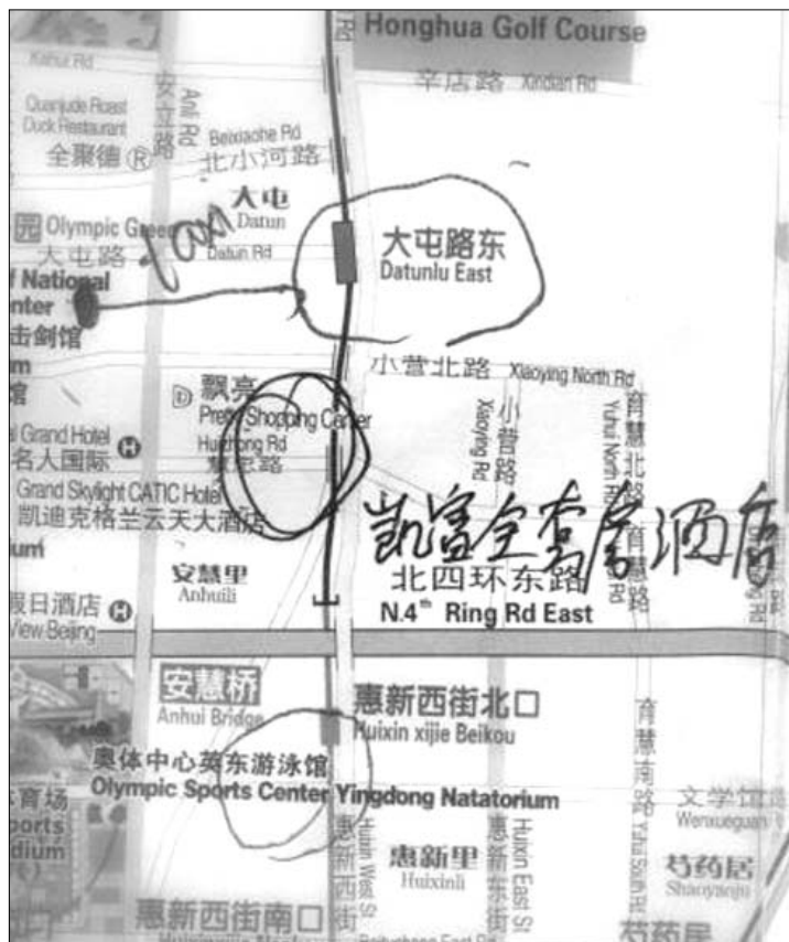
Indicazione in corsivo, sulla mappa di Pechino del luogo dove si sono svolte le gare all’Intersteno