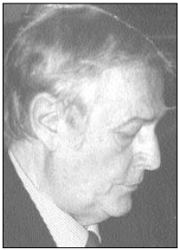
di PAOLO A. PAGANINI